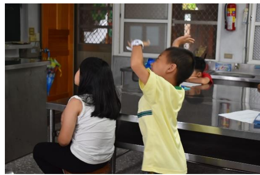
照片說明：歌曲教唱，全身動起來