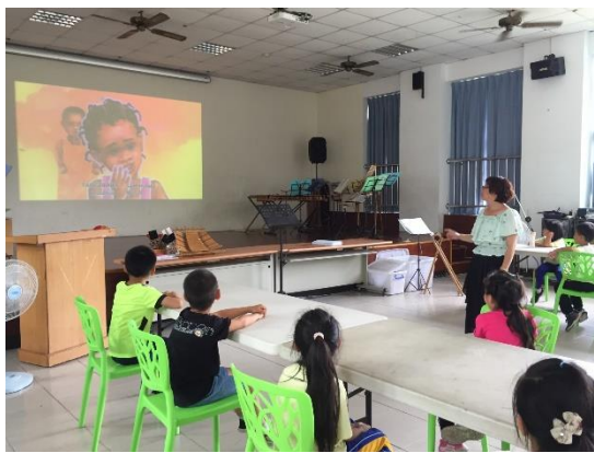
照片說明：英語繪本閱讀