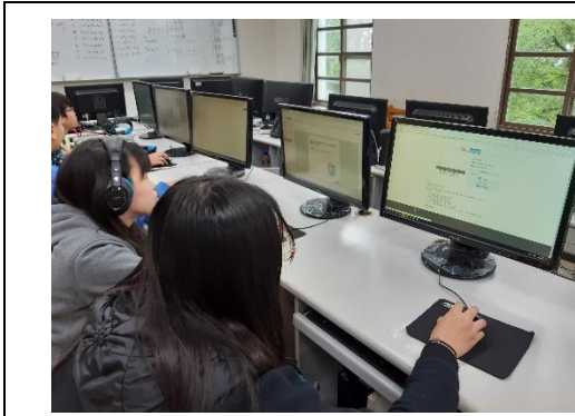
照片說明：學生運用學校設備，上線參加 Cool English 英閱王、英聽王比賽