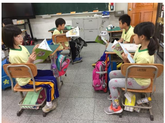
照片說明：英語朗讀練習