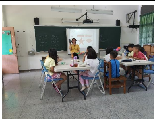
照片說明：圖形知多少