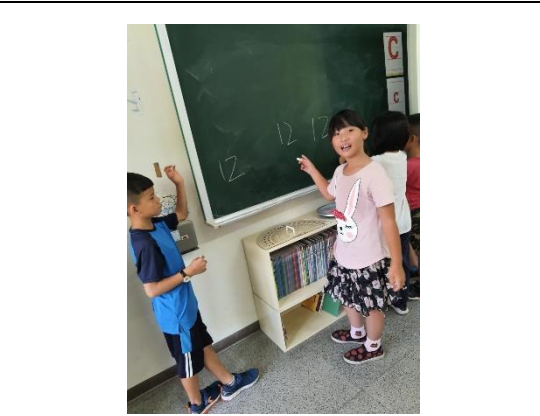
照片說明：數字聽聽看