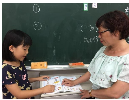
照片說明：口說考試