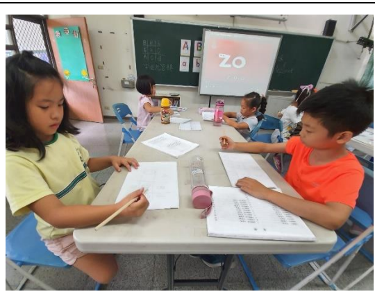
照片說明：字母九宮格，你記得多少？