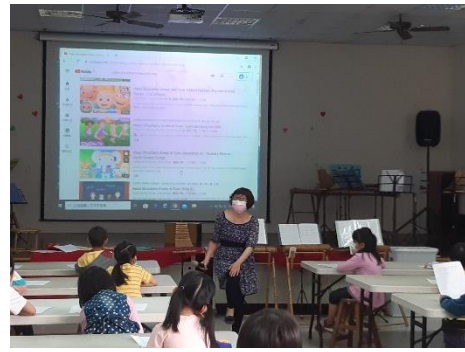
照片說明：全校英語日，運用兒歌，幫助學生記得身體部位英語名稱