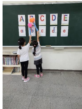
照片說明：字母初相見