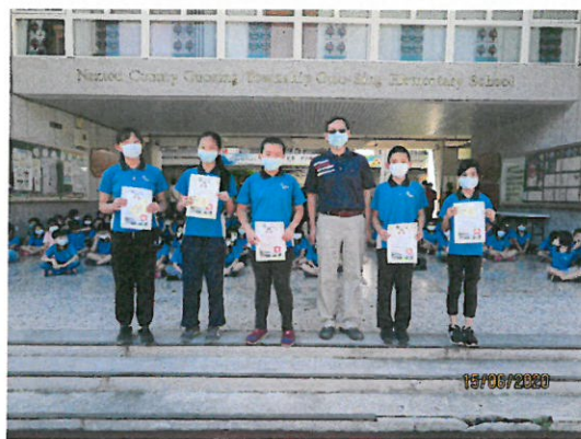
英語大會考特優的學生。