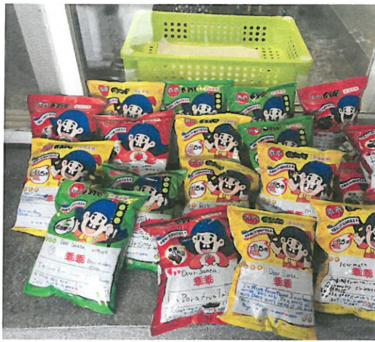
學生們的聖誕乖乖。