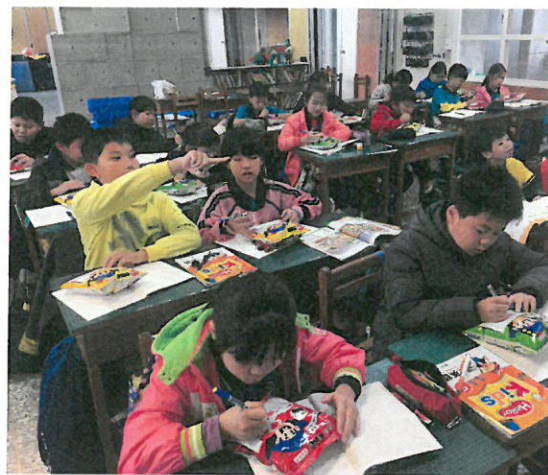
學生把自己的聖誕願望寫在乖乖上。