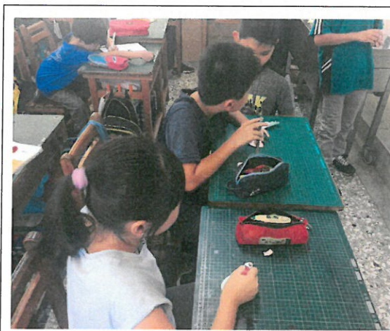
學生撰寫感恩便條紙。