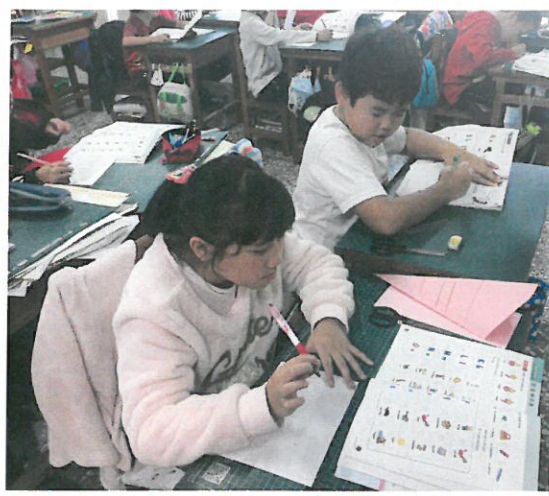
學生專心設計自己的 name card