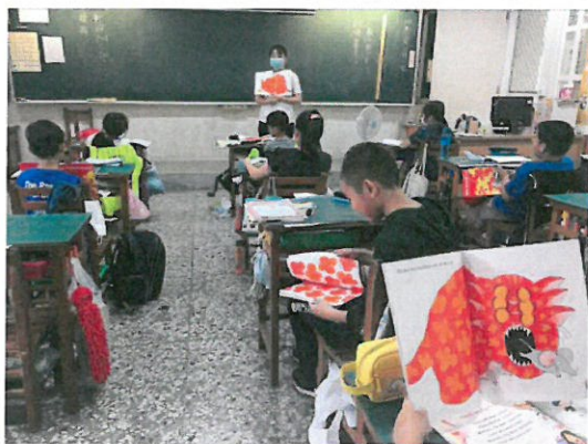
老師帶著孩子一起閱讀繪本。