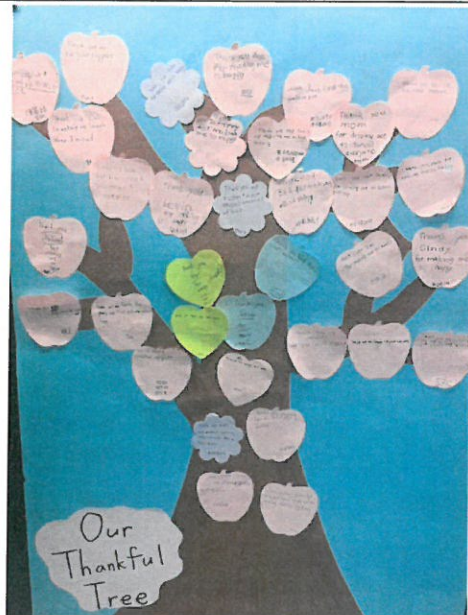
學生所完成的感恩樹