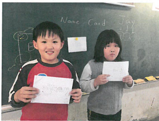
學生和自己的 name card 合影。