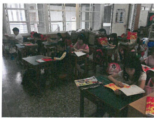
學生自行閱讀繪本。