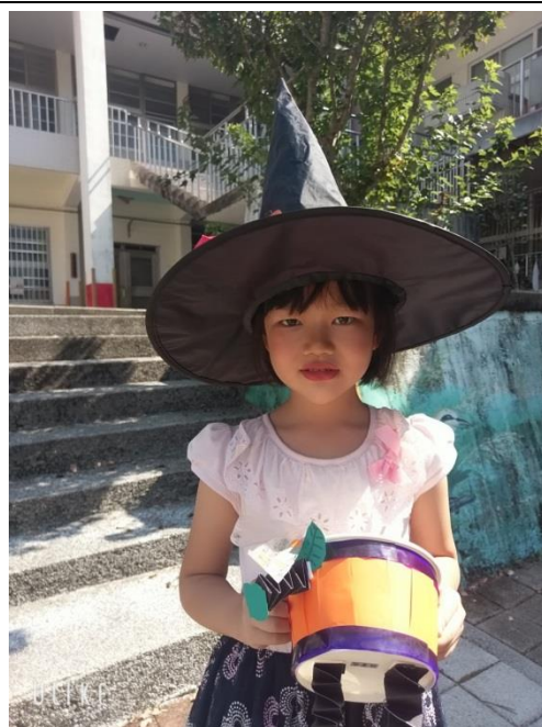
配合西洋節情變裝派對