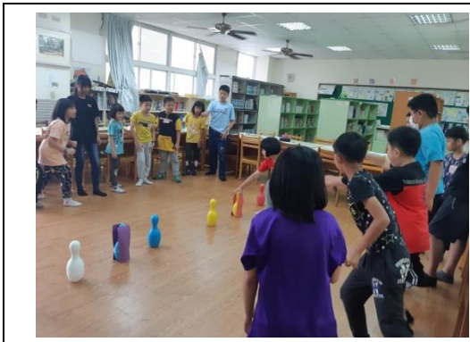
從遊戲中學習英語