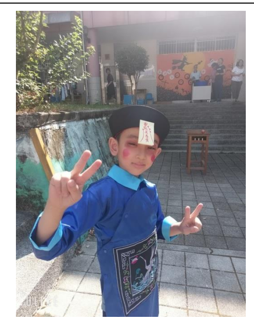
配合西洋節情變裝派對