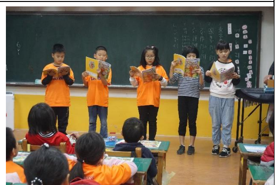
兒童朝會-英語朗讀