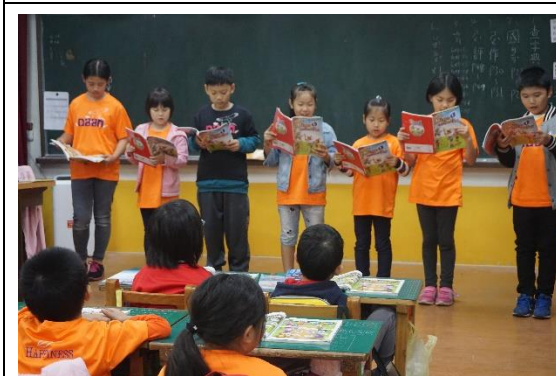
兒童朝會-英語朗讀