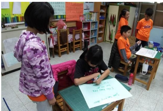
異質性能力分組練習-能力強的小朋友協助能力較弱的同儕