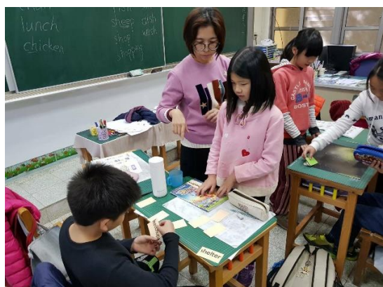
同質性能力分組練習-分二組，一組練習基本題，另一組練習進階題