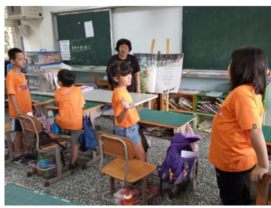
小朋友實際用英語練習打招呼