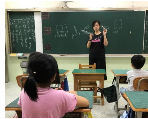
日常文具用品英文教學