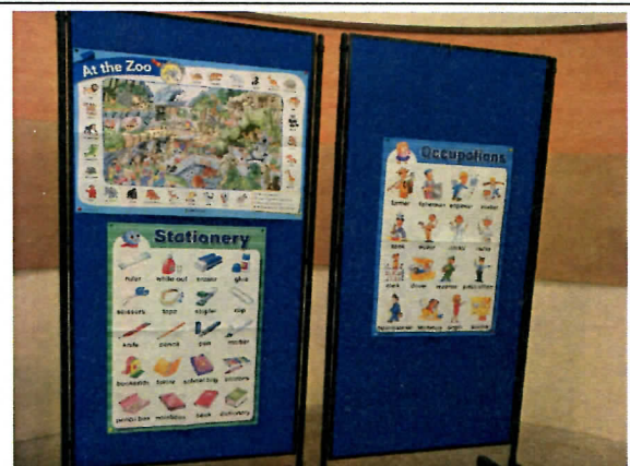
英語活動場域主題大圖輸出 2