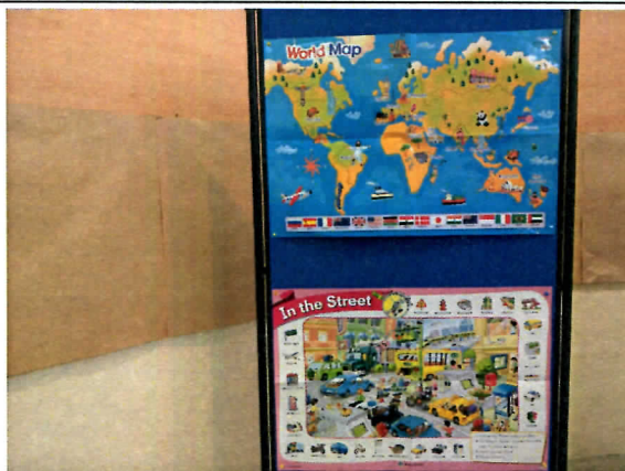
英語活動場域主題大圖輸出 1