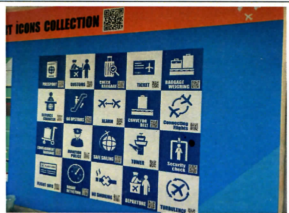
建置英語情境教室工程