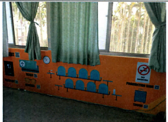
建置英語情境教室工程