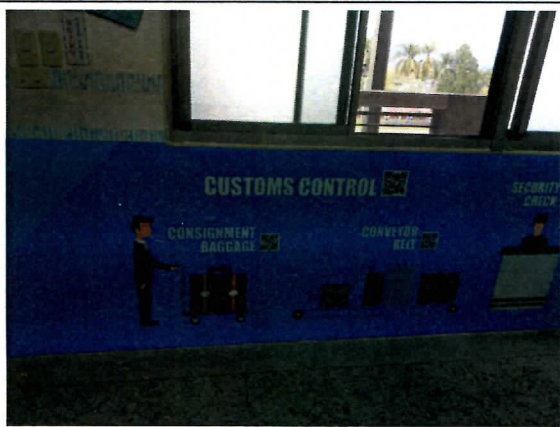
建置英語情境教室工程