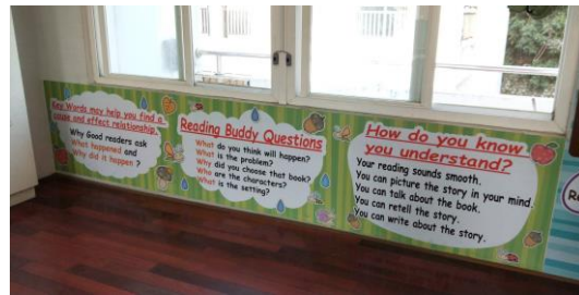
英語閱讀角情境布置