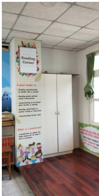
英語閱讀角情境布置