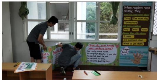
英語閱讀角情境布置