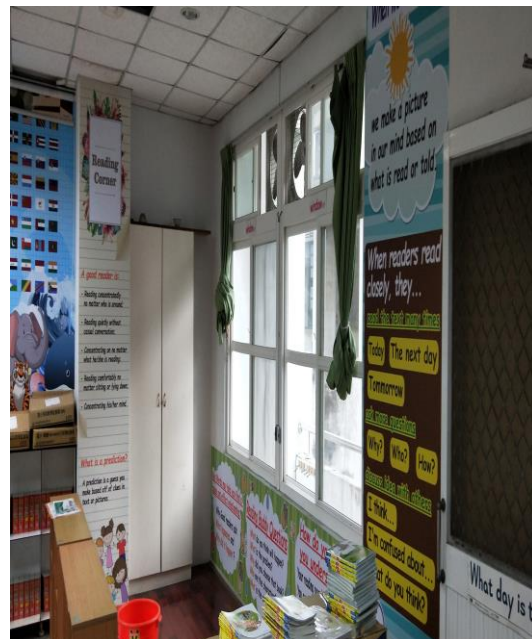
英語閱讀角情境布置