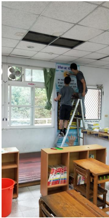
英語閱讀角情境布置