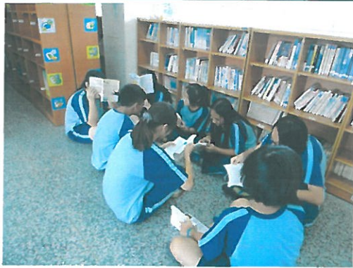
學生於閱讀角閱讀英語讀本