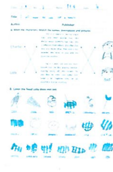
英語讀本學習作品