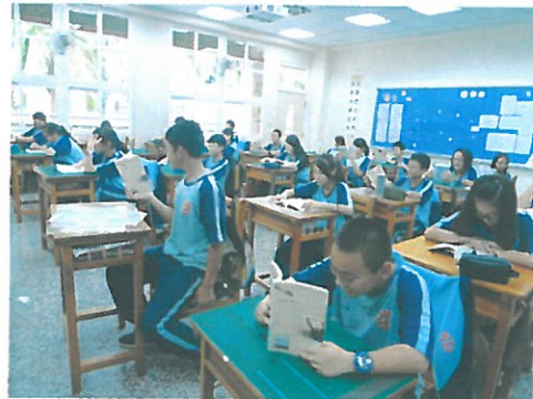
學生於晨間閱讀英語讀本