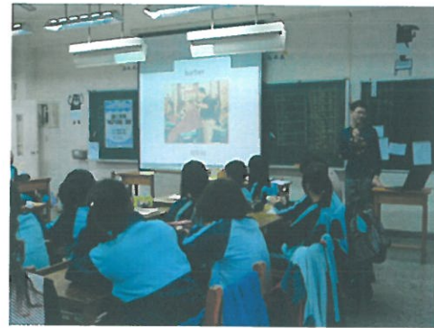
以英語影片營造語境