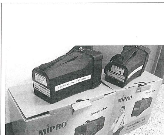
手提喊話器 2 部