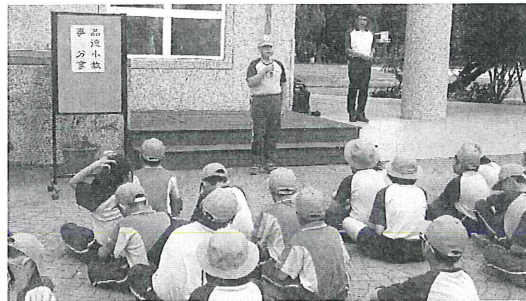
學生英語演說活動