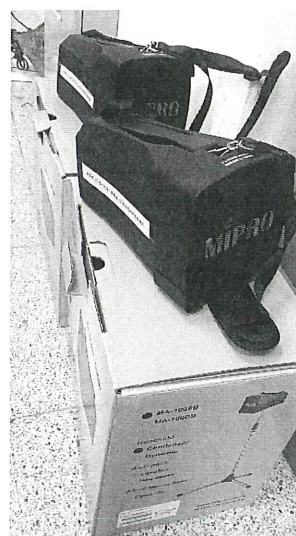
手提喊話器 2 部