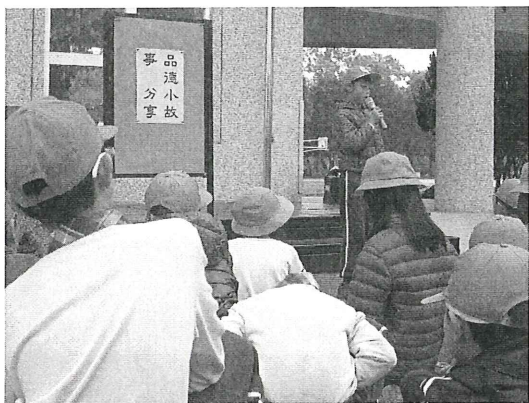
學生英語演說活動