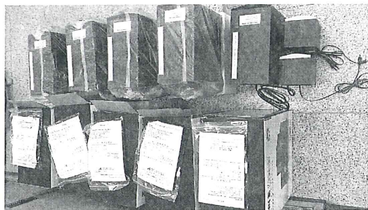
擴音喇叭 5 部