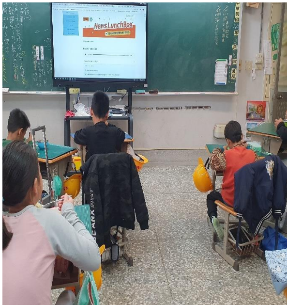
ICRT Lunch BOX