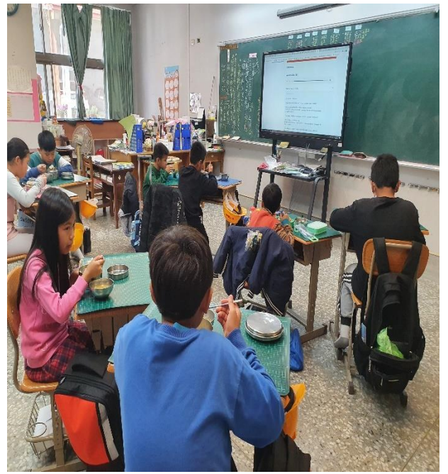
四年級的孩子們在桌邊用餐收聽中