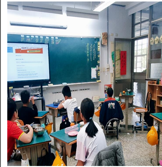
四年級的孩子們認真聽著廣播