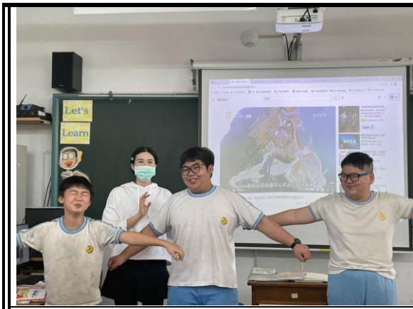
英語教師配合內容並設計遊戲與學生互動