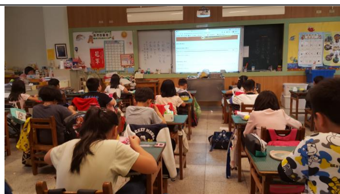
導師利用午餐時間讓學生聆聽