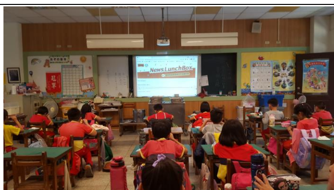
導師利用午餐時間讓學生聆聽