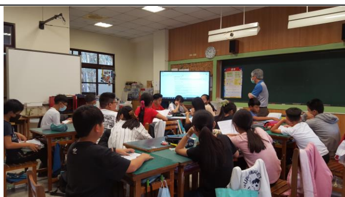
導師利用早自修時間指導學生聆聽