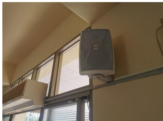
110. 2. 23 新設音響方便聆聽廣播