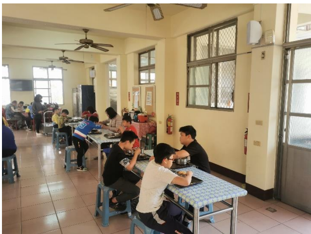
110. 3. 4 學生於用餐期間聆聽廣播