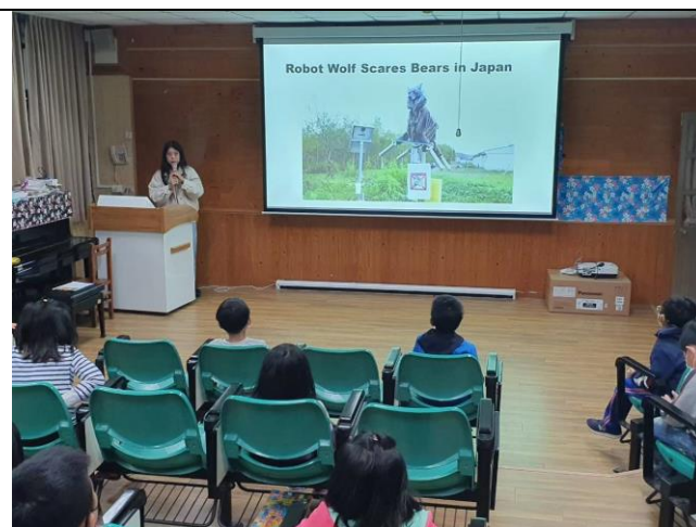
全校 ICRT 英文收聽