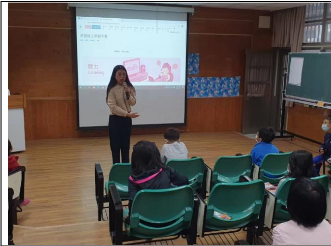
全校 ICRT 英文收聽