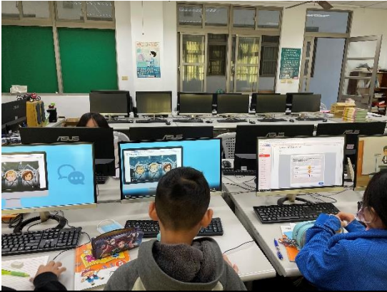
上網查詢並閱覽相關影片