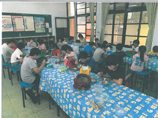
師生利用午餐時間播放，讓師生共同收聽