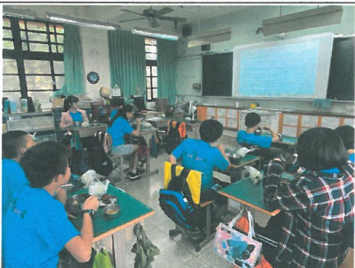
聽完一遍，再點開文字內容，檢視聽懂多少