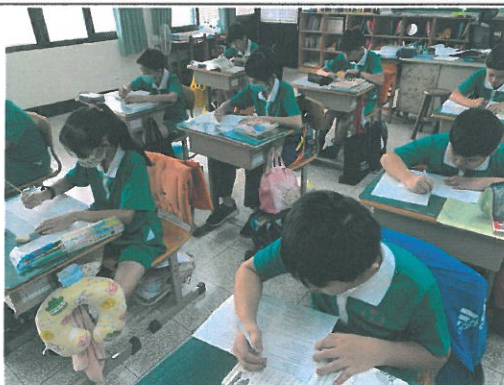
聽完文章再讀讀看，寫 Quiz。